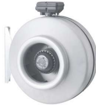
Общие характеристики вентилятора канального LKP